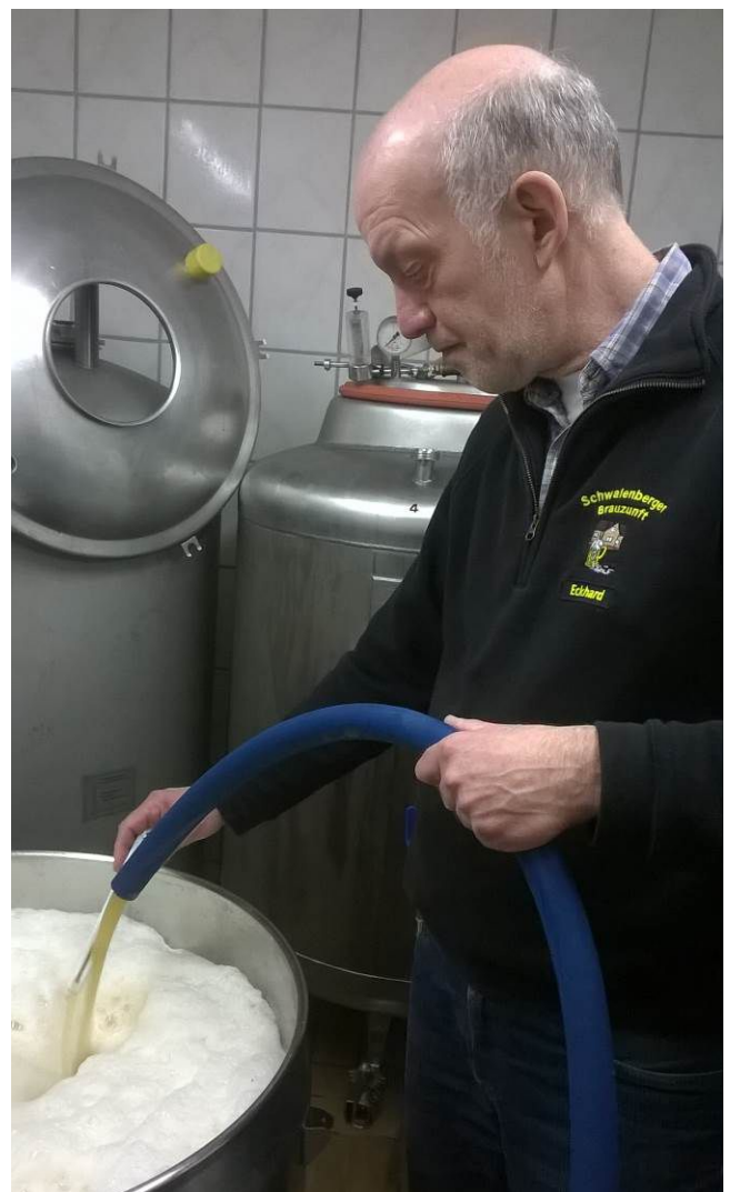
(Am Ende des Tages füllt sich die Gärwanne)

Was für uns „Gastbrauer“ manchmal unübersichtlich wirkte, hatte System: es wurde schnell deutlich, dass hier ein eingespieltes Team am Werke war, bei dem jeder seine Aufgabe kannte. Bei einem so eingespieltem Team konnten auch die Gäste nicht viel falsch machen. Das Brauen klappte also nicht wegen, sondern trotz des Vorstandsbesuches reibungslos. Und so war am Ende wie geplant die Gärwanne im Kühlhaus gut gefüllt und die Hefe konnte mit Ihrer Arbeit beginnen.