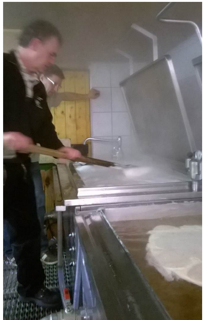
(Maischen in zwei Wasserkesseln)

Die Schwalenberger Brauzunft hatte schon länger die Idee, mal einen gemeinsamen Sud mit dem VHD-Vorstand zu machen. Das 10-jährige Jubiläum, das die Brauzunft in diesem Jahr feiert, bot eine perfekte Gelegenheit, diese Idee auch in die Tat umzusetzen.