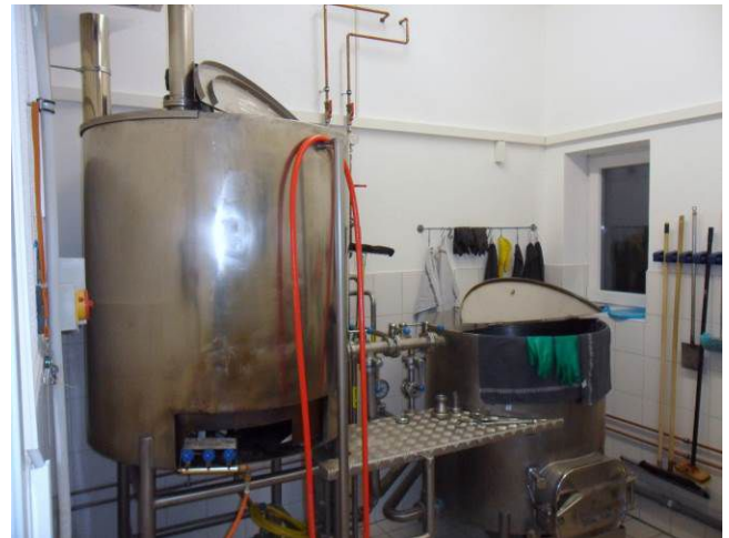
(Alte Brauanlage, neue Verwendung)

Dazu wurde eine alte Gasthausbrauanlage optimiert und eingebaut.