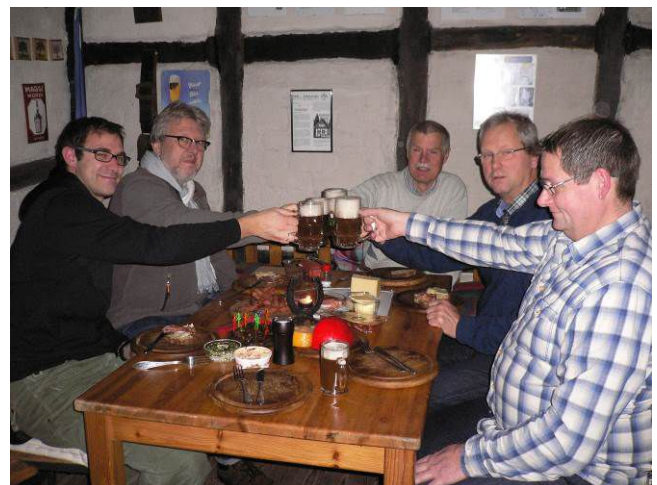
(Anstoßen mit dem Weihnachtsbier)

Zum Ausklang des Jahres 2014 haben wir mit unserem „Lötti – Weihnachtsmann“ einen Volltreffer gelandet. Es war ein richtig leckeres, gehaltvolles, untergäriges Bier mit einer leichten Hopfennote. Durch einen Gewürzsud mit Vanillestangen, Zimtstangen, Sternanis und Nelken sowie einem Glas Honig aus eigener Herstellung schmeckte es angenehm weihnachtlich - hierfür ließen wir gerne jeden Glühwein stehen. (Wer sich für das genaue Rezept interessiert, meldet sich unter loetti@hausgebraut.de ).