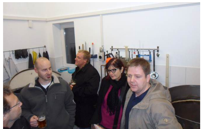
(Die Sudfreunde Wohratal bei der Führung)

Bei der Eröffnungsfeier im September wurde dann das Junkern-Pils mit Begeisterung verkostet und auch am Abend der Besichtigung konnte das Junkern-Pils in der Brauerei verkostet werden.