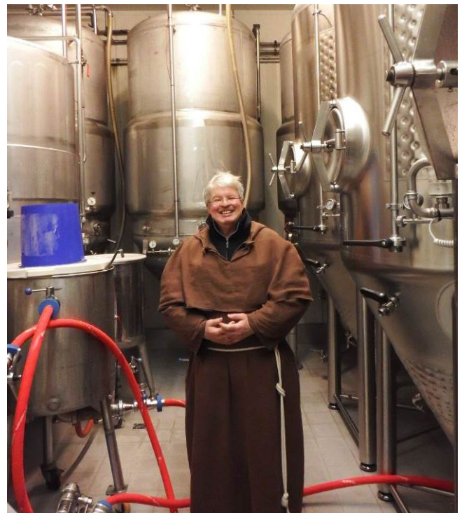
(Eine Brauereibesichtigung beim Jahresausflug)

Unser Jahresausflug ging dieses Jahr nach Mühlhausen in Thüringen. Nach Bezug unserer Zimmer trafen wir uns am Anreisetag freitagabends im Lokal „Brauhaus zum Löwen“ zum Abendessen. Der Abend war kurzweilig bei einem guten „Apothekerbier“, Spezialität der Gasthausbrauerei. Am nächsten Morgen nach einem reichlichen Frühstück war die Besichtigung der Gaststättenbrauerei auf unserem Terminplan. Danach schlossen wir uns spontan der Stadtführung an.