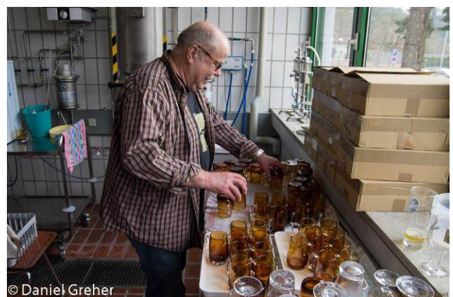
(Hier spült der Kassierer)

Nach der Mittagspause wurde dem nächsten Schwerpunkt ausreichend Platz eingeräumt: Dem Vergleich verschiedener Biersorten. Robert stellte die Merkmale der Biersorten jeweils am Beispiel eines typischen Vertreters dieser Sorte vor. Eine vergleichende Bierverkostung entsprechend dem Verkostungsschema der jährlichen Haus- und Hobbybrauertage stand ebenfalls auf dem Programm. Die immer wieder eingestreuten Erläuterungen zum Thema „Geschmacksfehler im Bier und deren Ursachen im Brauprozess“ waren ebenfalls hoch interessant.