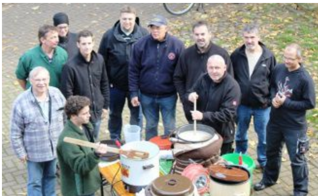
(Gemeinsames Brauen der Generationen)

In einer ersten Runde am Freitagabend vermittelte der Ebstorfer Hobbybrauer den Teilnehmern theoretisches Brauwissen. Eigentlich waren dafür zwei Stunden angesetzt, doch die Zeit verging wie im Fluge, sodass es am Ende mehr als vier Stunden waren. Am zweiten Tag stieg die Runde in die Praxis ein. Aufgeteilt in zwei Gruppen wurden ein untergäriges, rötliches Landbier und ein obergäriges Weizenbier angesetzt.